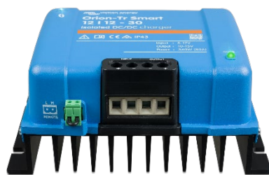
Orion-Tr Smart 12/12-30